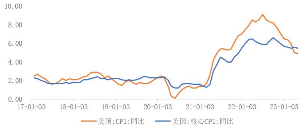
美国消费品物价指数