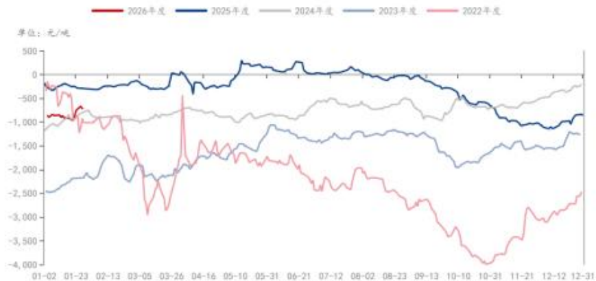
MEG: 煤基合成气制: 生产毛利: 中国 (日)