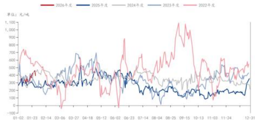
PTA: 加工费: 中国 (日)