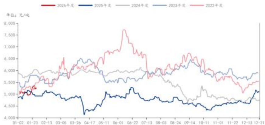
PTA: 市场价: 华东地区 (日)