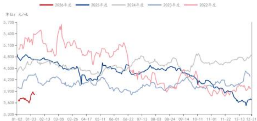
MEG: 市场低端价: 华东地区 (日)