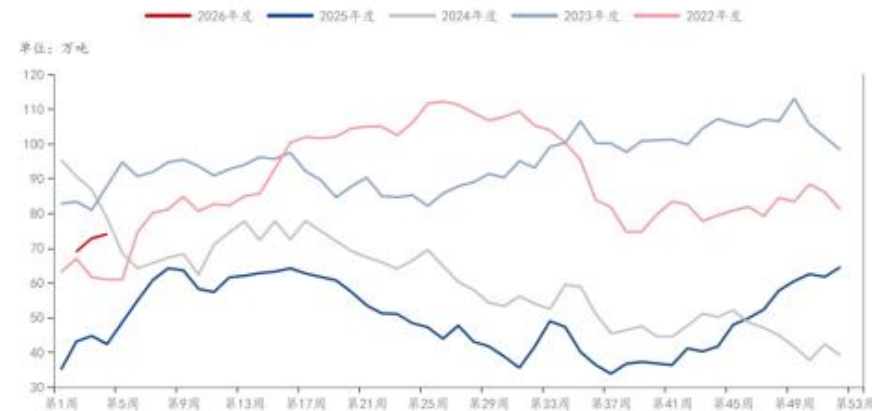
MEG: 港口库存: 华东地区 (不含宁波) (期末) (周)