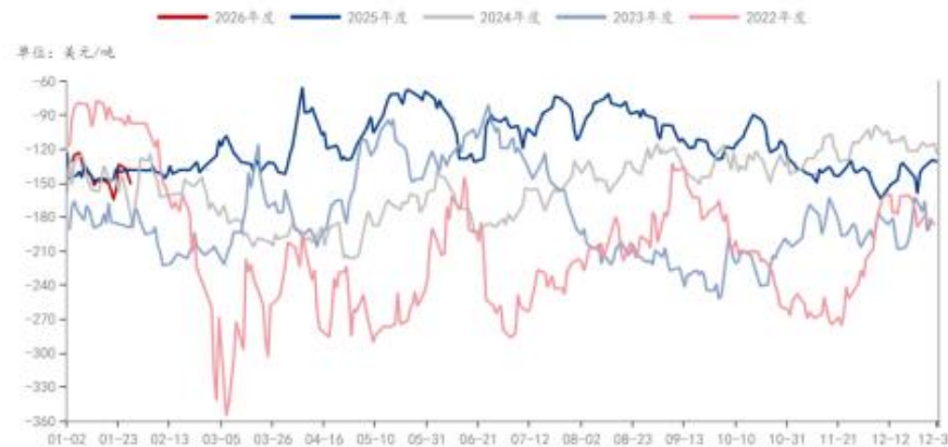
MEG: 石脑油一体化制: 生产毛利: 中国 (日)