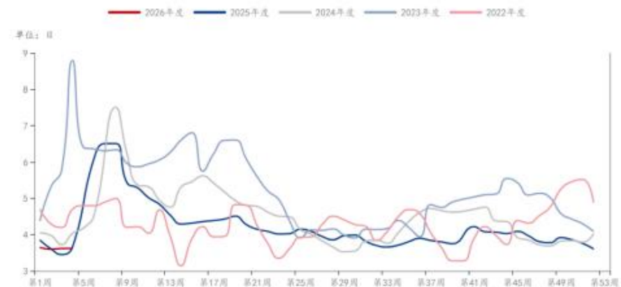
PTA: 厂内库存可用天数: 中国 (周)