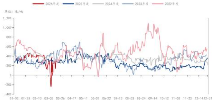
PTA: 加工费: 中国 (日)