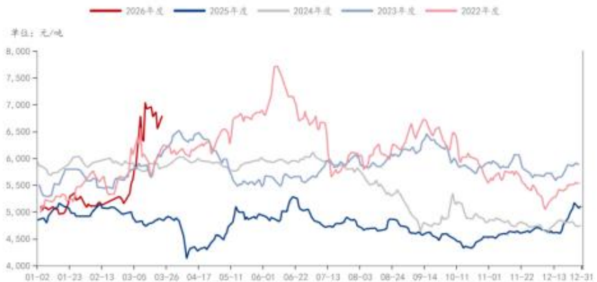
PTA: 市场价: 华东地区 (日)