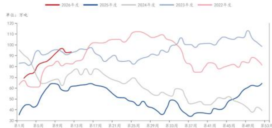
MEG: 港口库存: 华东地区 (不含宁波) (期末) (周)