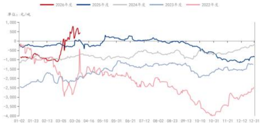
MEG: 煤基合成气制: 生产毛利: 中国 (日)