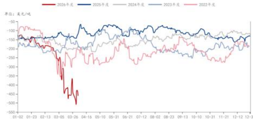
MEG: 石脑油一体化制: 生产毛利: 中国 (日)