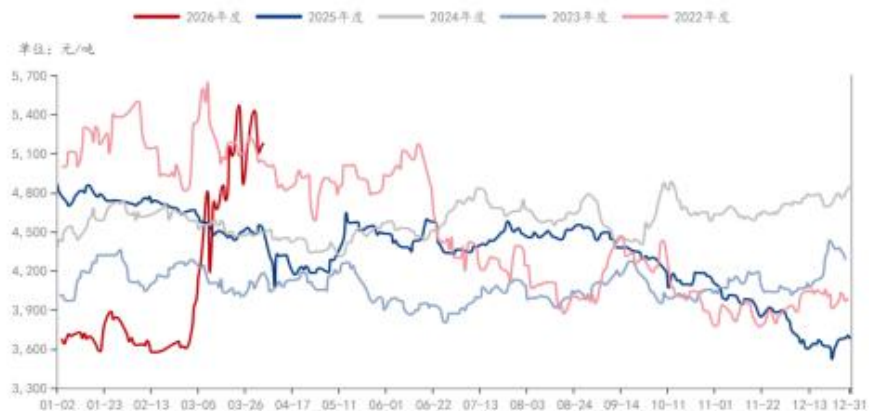
MEG: 市场价: 华东地区 (日)